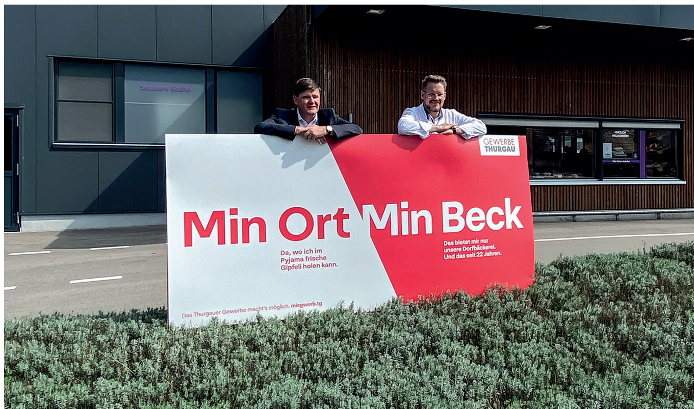
Mit einer öffentlichkeitswirksamen Kampagne unterstützt der Thurgauer Gewerbeverband die Gewerbebetriebe.

Das Jahr 2020 hat eines ganz deutlich gemacht: Der TGV ist ein zentraler Ansprechpartner für die Exekutive in unserem Kanton. Neben diesen ausserordentlichen Einsätzen ging das übliche Tagesgeschäft nicht vergessen. So hat sich der TGV im Berichtsjahr stark in Abstimmungskämpfen engagiert. Der klare Sieg der Vorlage für die kantonale Steuerreform im Februar 2020 ist auf den hohen und kämpferischen Einsatz gewerblicher Vertreterinnen und Vertreter zurückzuführen. Bei den zwei weiteren kantonalen Vorlagen bezüglich des