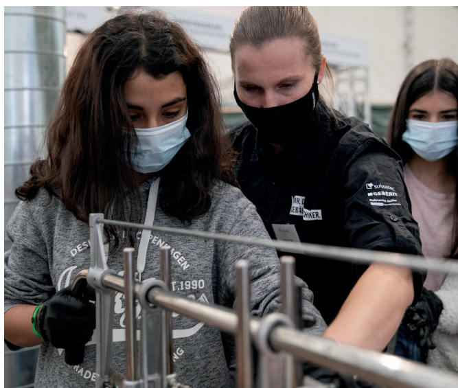
Berufsmesse Thurgau - Der Treffpunkt für Berufswahl, Grund- und Weiterbildung.

Sie werden auch im Jahr 2021 alle Hebel in Bewegung setzen, damit die Berufsmesse Thurgau vom 23. bis 25. September stattfinden kann.