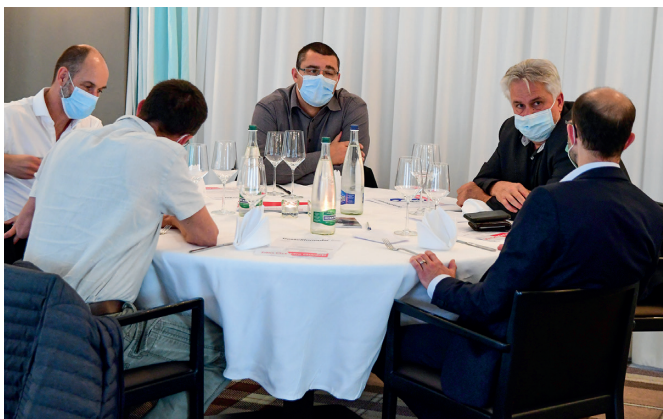
Teilnehmer der Präsidentenkonferenz pflichtbewusst mit Maske.