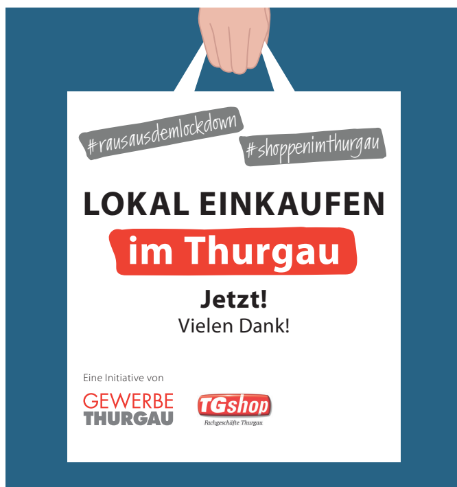
Einkaufen im Thurgau: Jetzt erst recht eine Selbstverständlichkeit!

Ergänzungsbaus des Regierungsgebäudes bzw. der Turnhalle am BZT in Frauenfeld engagierte sich der Verband ebenfalls. Nach der deutlichen Nein-Parole zur Konzernverantwortungsinitiative durch die Präsidentenkonferenz kämpfte der TGV zusammen mit der IHK erfolgreich für deren Ablehnung. Mit Stellungnahmen zu zahlreichen Themen – unter anderem zum Voranschlag 2021 des Kantons und zur geplanten Prozessüberprüfung für Planungs- und Baugesuche im Departement für Bau und Umwelt – nahm der TGV im Jahr 2020 die Interessen seiner Mitglieder in der kantonalen Politik wahr. Zudem liess sich die Wirtschaftsgruppe des Grossen Rates im Frühling über den Stand der Dinge des geplanten Berufsbildungscampus Ostschweiz (BCO) orientieren. Eine geplante Veranstaltung im Herbst mit Regierungsrat Urs Martin – dem neuen Finanzchef – soll im 2021 nachgeholt werden.